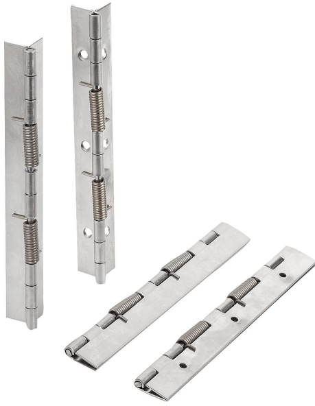
Kapatma yaylı menteşeler